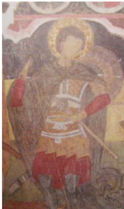
Образ 8 Изображение на св. Георги в църквата „Успение Богородично“, Арбанаси, XVII в.