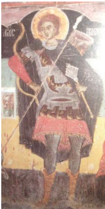
Образ 7 Изображение на св. Прокопий в църквата „Рождество Христово“, Арбанаси, XVII в.