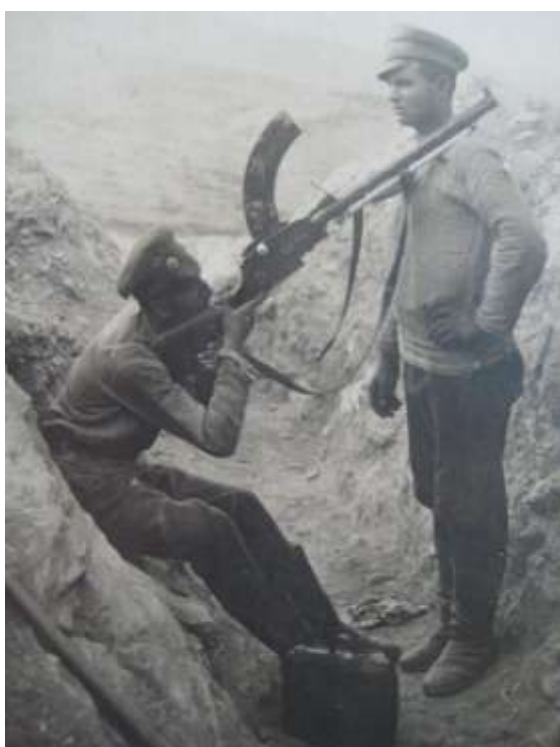
Български войници от неизвестна част с лека картечница „Мадсен“