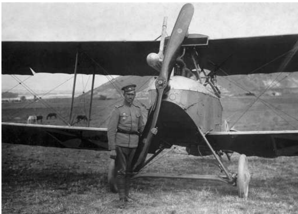
Летецът Радул Милков пред самолет „LVG“ В-II